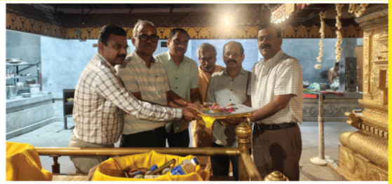
ആർ.ജി. ധർമ്മ പരിഷത്തിന്റെ ആസ്തിയിൽ, പുതുതായി ചേർക്കപ്പെട്ട ഭവനത്തിന്റെ (House no 49-B, Pocket 3), രേഖകൾ ഭഗവൽ സന്നിധിയിൽ സമർപ്പിക്കുന്നു