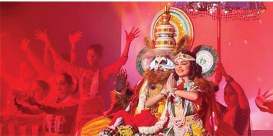
വിഷ്ണുപ്രിയ നാട്യാലയ അവതരിപ്പിച്ച 'നരസിംഹ' എന്ന നൃത്തനാടകത്തിലെ ഒരു രംഗം