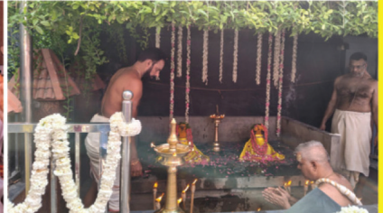
മെയ് 11-നു നടന്ന തന്ത്രിയുടേ കാർമ്മികത്വത്തിൽ നടന്ന വിശേഷാൽ നാഗപൂജ