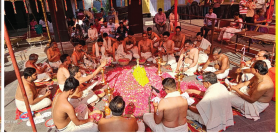
ഉത്സവത്തിനു മുന്നോടിയായി മെയ് 8- നു നടന്ന ലക്ഷാർച്ചന