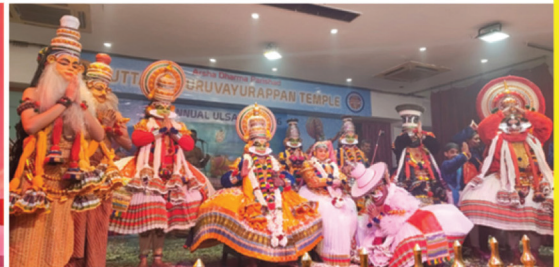
മെയ് 10-നു, സൽഹി കഥകളി സെന്റർ അവതരിപ്പിച്ച ശ്രീരാഘട്ടാദിഷേകം കഥകളിയിലെ ഒരു രംഗം