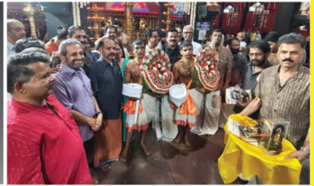
മെയ് 9 നു നടന്ന തിടമ്പുസ്തുത്തിൽ പങ്കെടുത്തവരെ ആദരിച്ചപ്പോൾ