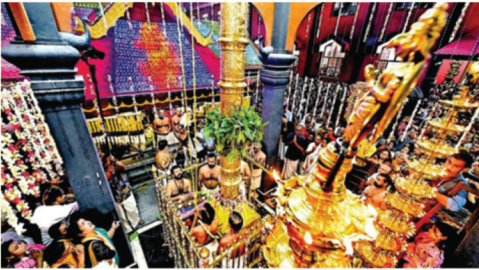
37-ാമതു തിരുവുത്സവത്തിനു, തന്ത്രി കൊടിപൂജ നടത്തുന്നു. (10.05.2026)