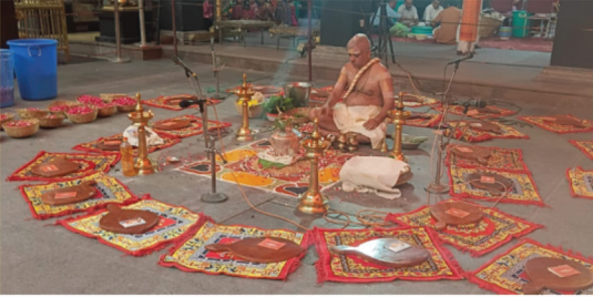
കളഭാദിഷേകത്തിനുള്ള കളഭം, തന്ത്രി പൂജിക്കുന്നു.